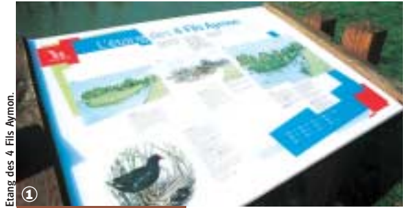
Étang des 4 Fils Aymon.