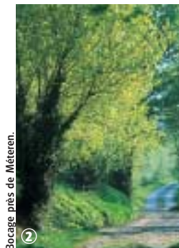
Bocage près de Méteren.