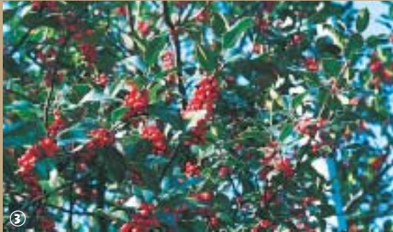
Houx en parure rouge.

La Flandre ne se réduit pas au plat pays ou, par opposition, aux Monts de Flandre. Elle est parfois désignée, notamment dans la région de Wormhout, sous le qualificatif d'Houtland. Bizarrement, ce n'est